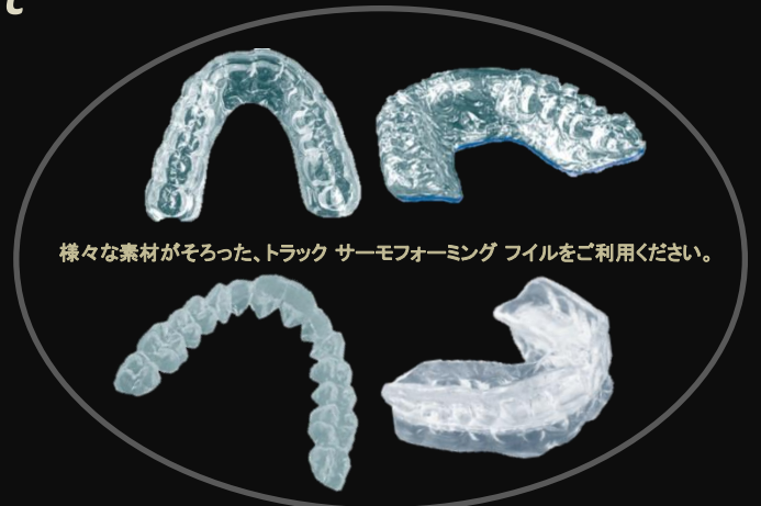
様々な素材がそろった、トラック サーモフォーミング フォイルをご利用ください。

ユーザープログラムを利用して現在使用している他社製のフォイルをお気に入りリストに登録しておくと、いつでも迅速に作業することができます。